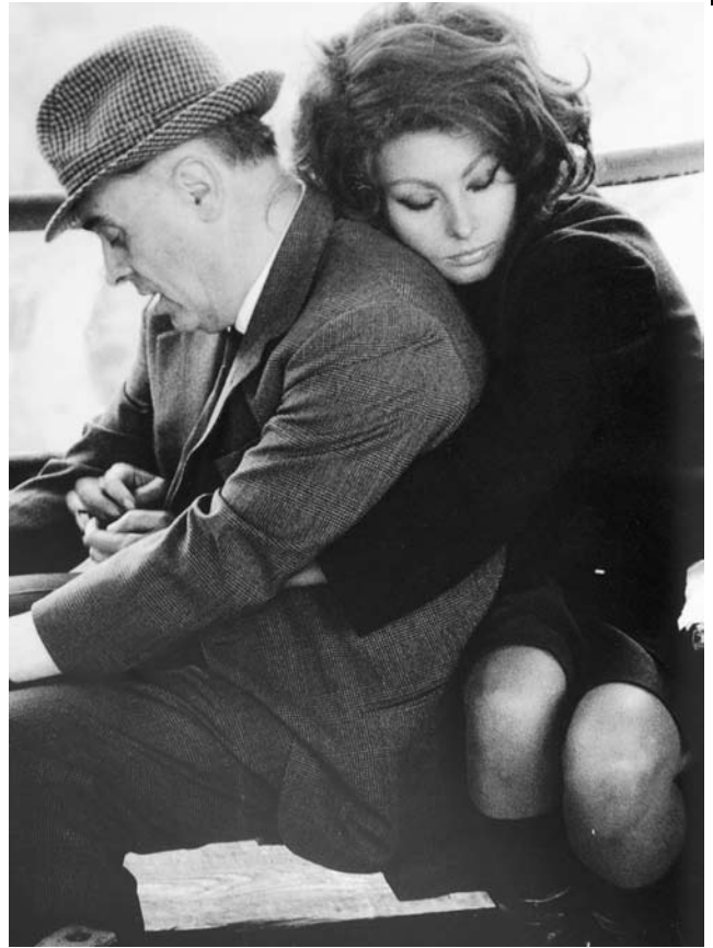
Sophia och hennes numera avlidne kärlek Carlo Ponti.

»NÄR SOPHIA FYLLDE 14 ÅR UTVECKLADES HON OCH VAR PLÖTSLIGT EN MYCKET VACKER OCH KURVIG UNG KVINNA. MAMMA ANMÄLDE HENNE TILL EN SKÖNHETSTÄVLING I NEAPEL.«