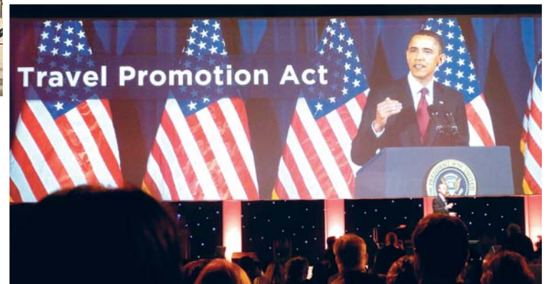
President Obama talade till 5.000 Pow Wow delagater under lunchen.