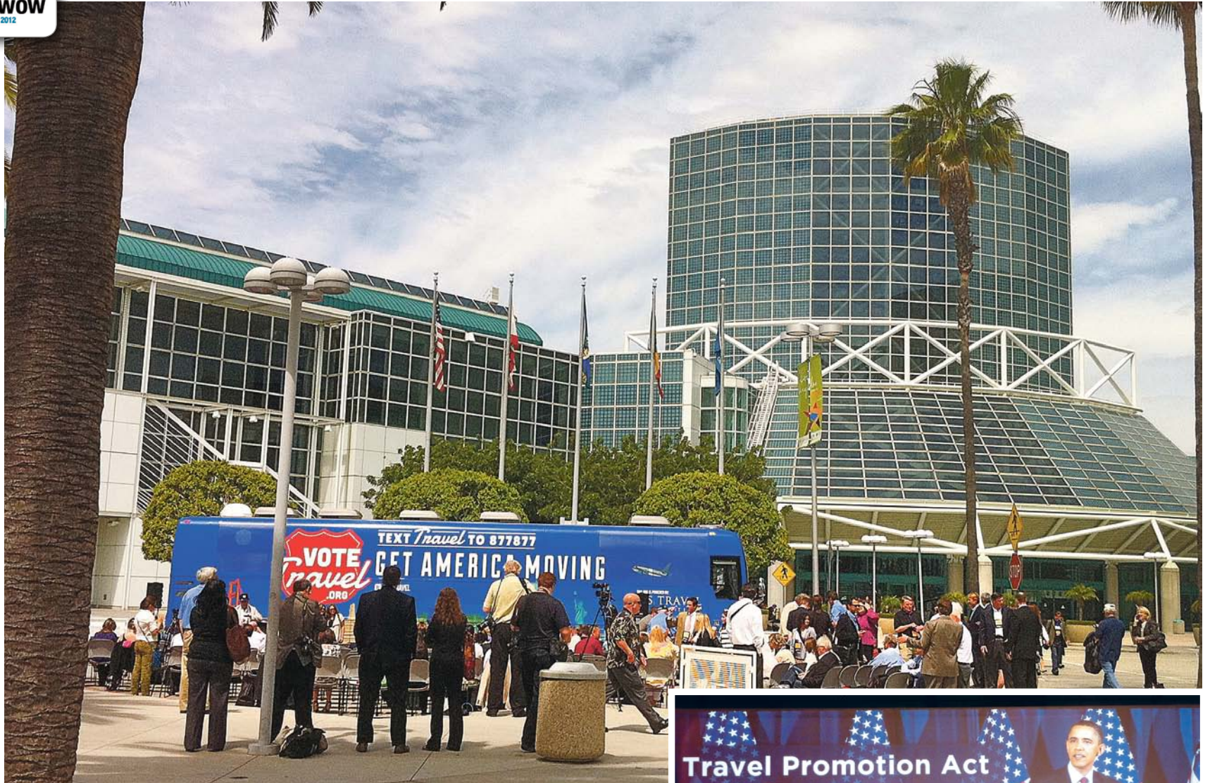
Vote Travel bussen framför mässan.