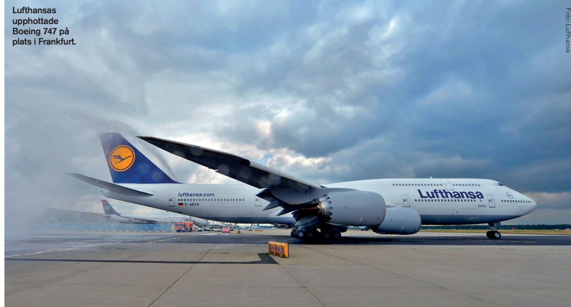
Lufthansas upphottade Boeing 747 på plats i Frankfurt.