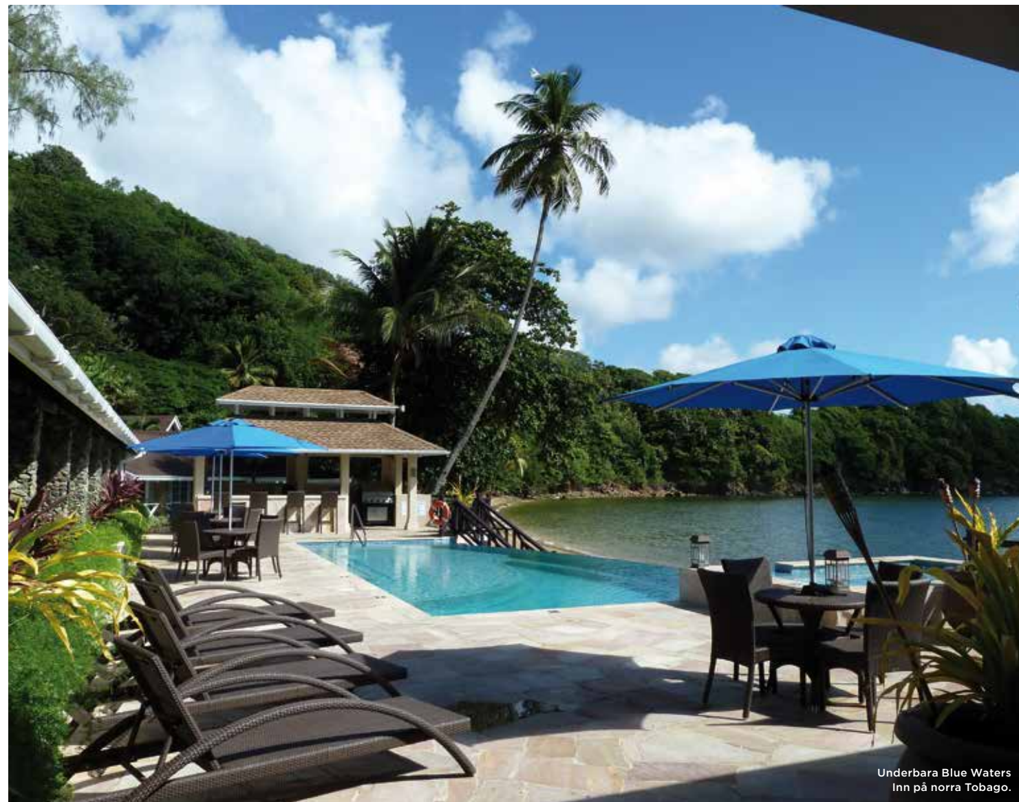
Underbara Blue Waters Inn på norra Tobago.

HÄR BJUDS PÅ EN BLANDNING AV GAMMAL KOLONIALSTIL OCH NYA HÖGA BYGGNADER SOM LYXHOTELLET HYATT VID VATTNET NÄRA HAMNEN.