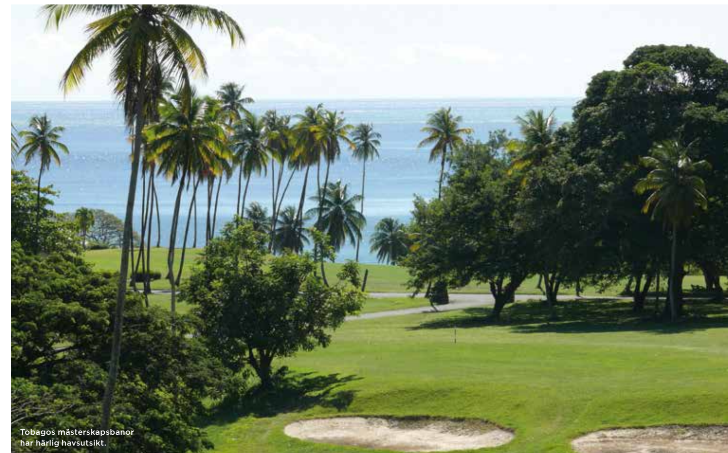
Tobagos mästerskapsbanor har härlig havsutsikt.

Även flyg från Göteborg och Köpenhamn finns. Kontakta oss för prisuppgift.