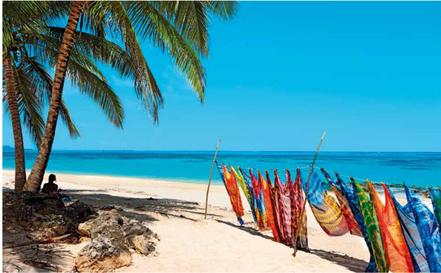
Utsikten över öarna utanför Tobago.