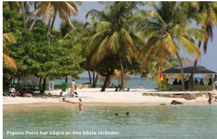
Pigeon Point har några av öns bästa stränder.

VÄGARNA ÄR BITVIS BÅDE SLINGRIGA OCH SMALA, HÄR ÄR DET VÄNSTERTRAFIK. DET ÄR SKÖNT ATT INTE KÖRA SJÄLV FÖR DÅ KAN MAN NJUTA HELHJÄRTAT AV DEN MAGNIFIKA UTSIKTEN.